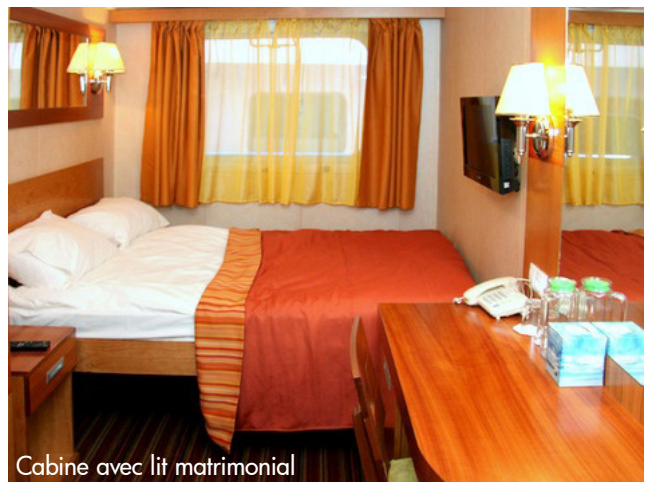
Cabine avec lit matrimonial