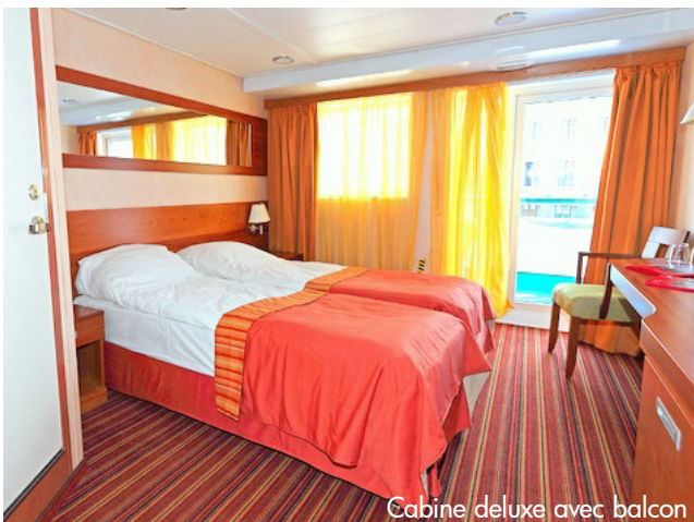
Cabine deluxe avec balcon