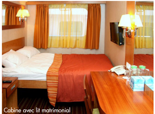
Cabine avec lit matrimonial