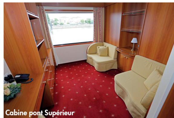
Cabine pont Supérieur