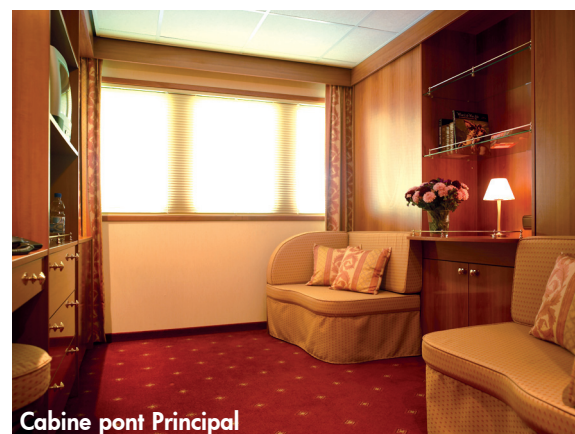
Cabine pont Principal