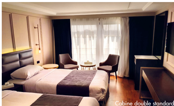
Cabine double standard

Toutes les cabines sont extérieures, avec grandes baies ouvrables sur toute la largeur de la cabine (balcons à la française). Elles sont spacieuses (22 m 2 ), climatisées individuellement, et sont équipées de deux lits séparés ou un grand lit double, d'une grande console, de deux fauteuils avec table basse, de TV satellite, de coffre fort et de petit réfrigérateur. La salle de bain dispose d'un lavabo, d'une douche, de WC et de sèche-cheveux.