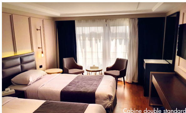
Cabine double standard

Toutes les cabines sont extérieures, avec grandes baies ouvrables sur toute la largeur de la cabine (balcons à la française). Elles sont spacieuses (22 m 2 ), climatisées individuellement, et sont équipées de deux lits séparés ou un grand lit double, d'une grande console, de deux fauteuils avec table basse, de TV satellite, de coffre fort et de petit réfrigérateur. La salle de bain dispose d'un lavabo, d'une douche, de WC et de sèche-cheveux.