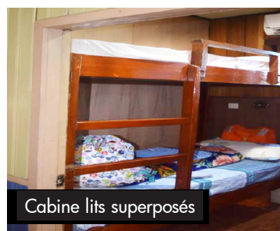
Cabine lits superposés