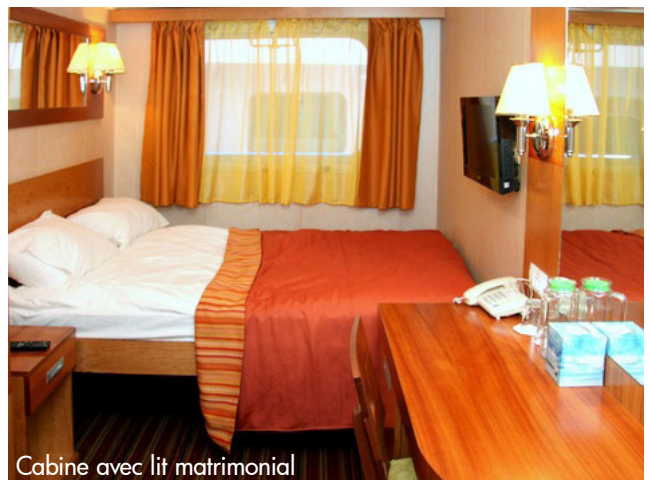
Cabine avec lit matrimonial