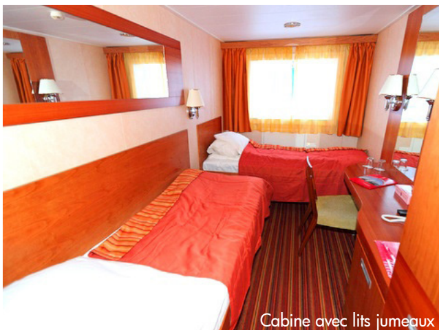
Cabine avec lits jumeaux