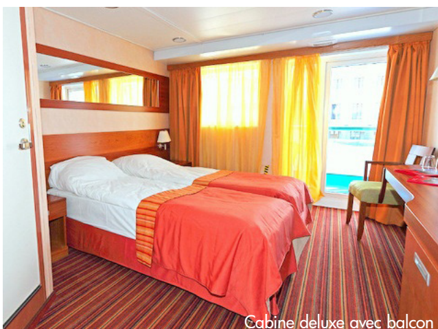
Cabine deluxe avec balcon