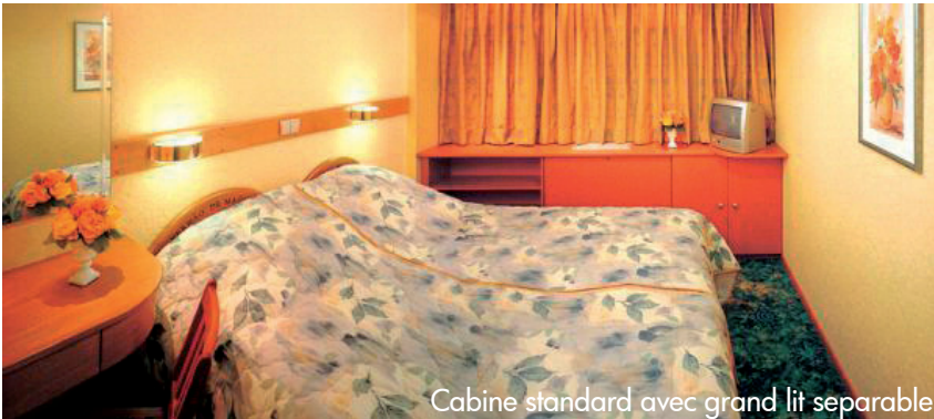
Cabine standard avec grand lit separable