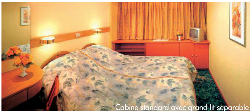
Cabine standard avec grand lit separable