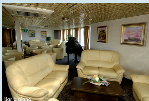
Bar à piano