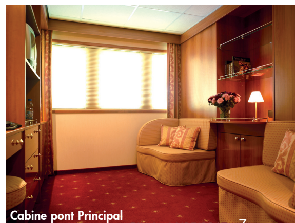
Cabine pont Principal