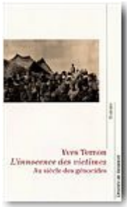
Yves Ternon Desclée de Brouwer, Paris, 2001